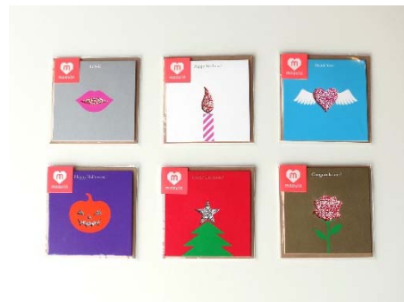
moovin カード「CUTOUT」シリーズラインナップ

CUTOUT シリーズではカード表面のイラストに抜き加工を施し、moovin カードの特徴と言える QR コードの一部を露出させ、その柄を活かすデザインになっております。Happy Birthday や Thank You ならびに Merry Xmas といった全 6 種類のテーマに応じたデザイン展開となり、また、各カードデザインに応じたオープニングムービーやフレームを動画に利用することができます。