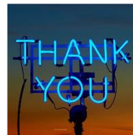
古平正義氏デザインの moovin カード(表面)