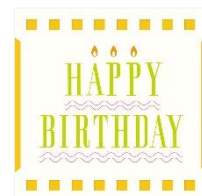
内田喜基氏デザインの moovin カード(表面)